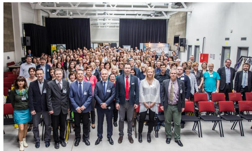
8. mezioborové sympozium a 3. celostátní foniatrcký seminář 2018 Screening sluchu novorozenců a dětí v ambulantní i klinické praxi 13. – 14. duben 2018, Hradec Králové